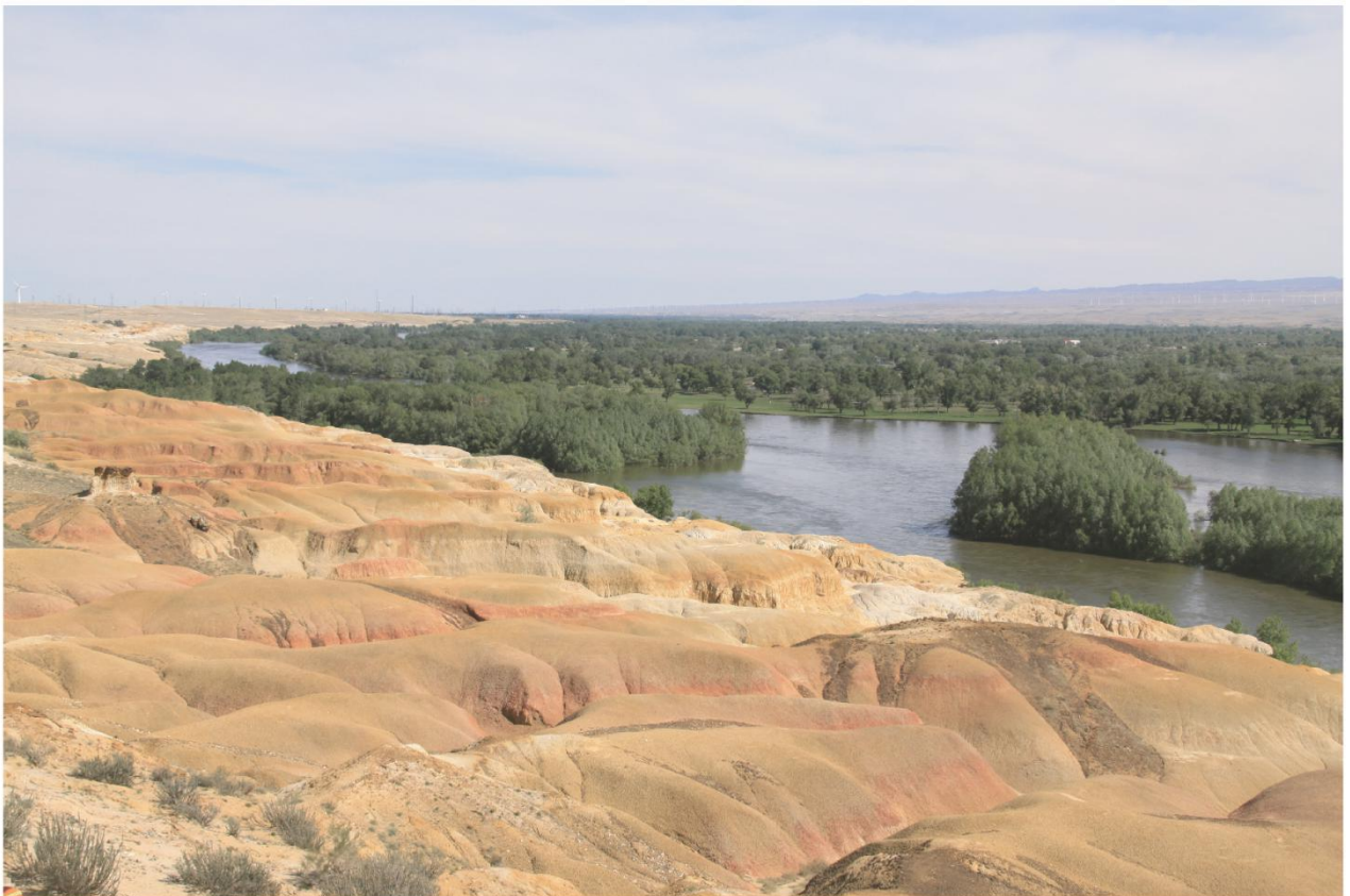
自东向西流淌的额尔齐斯河