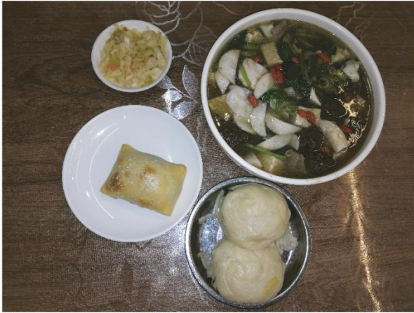
令人回味的烤包子